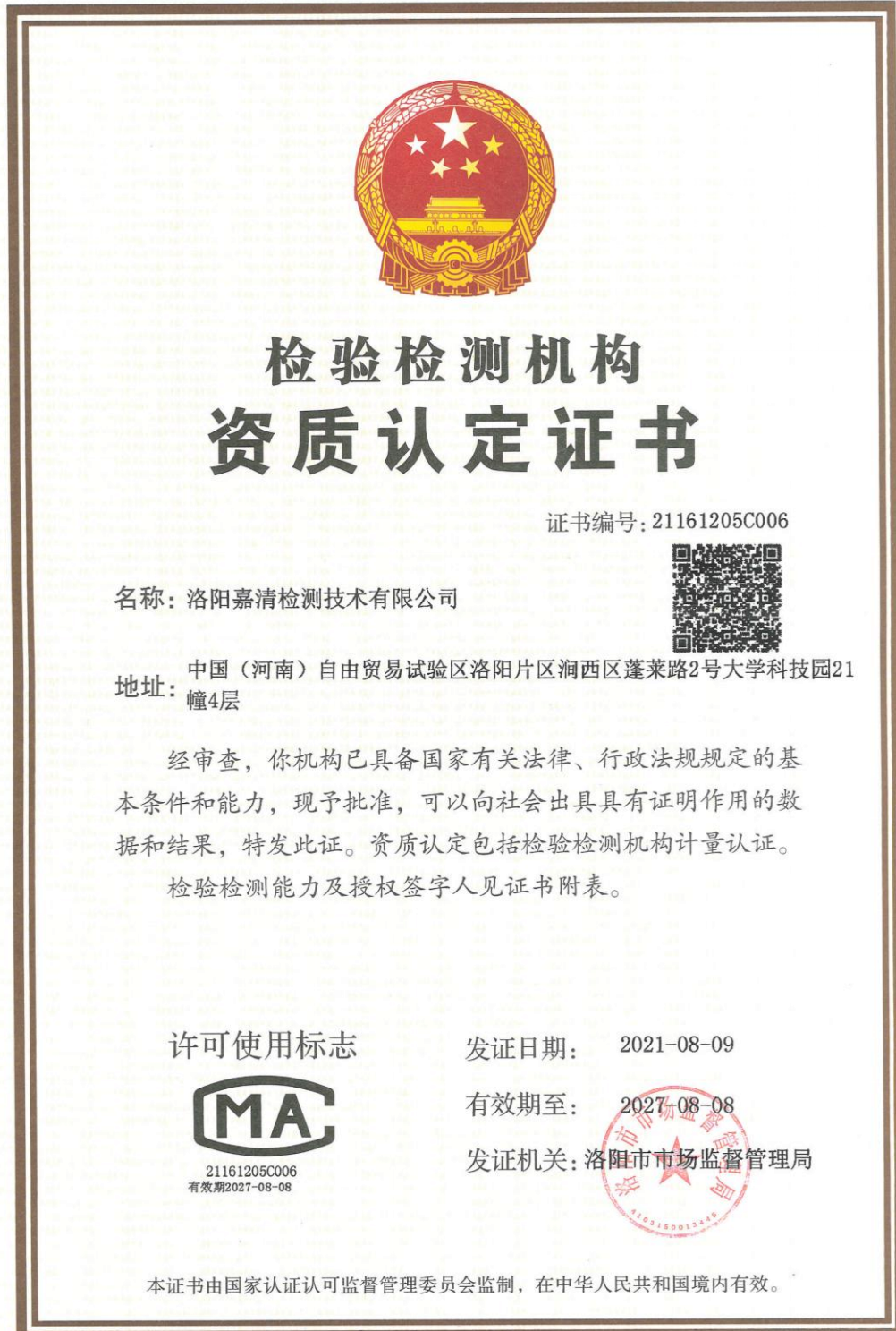
附图 2: 资质