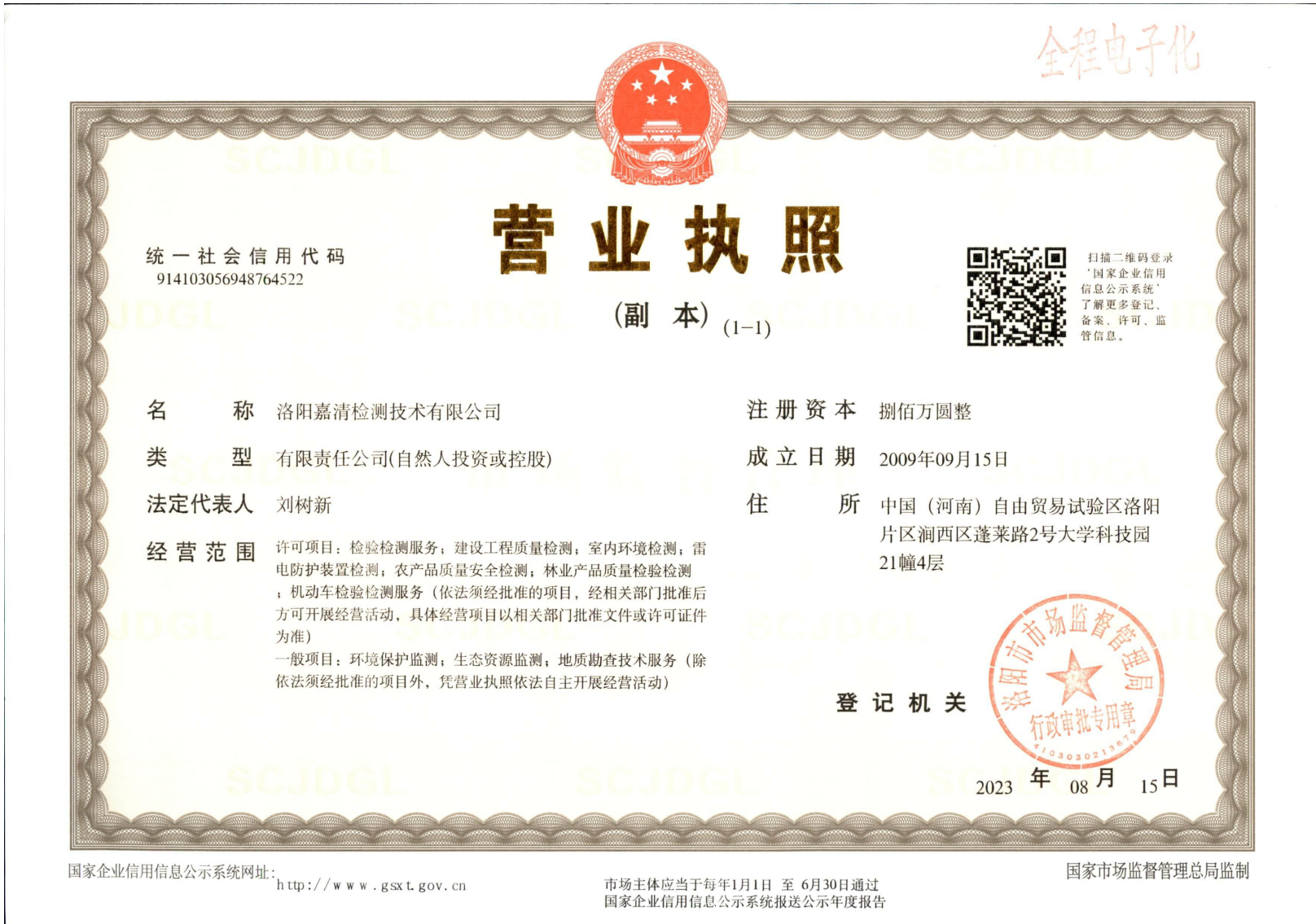
附图 1: 营业执照