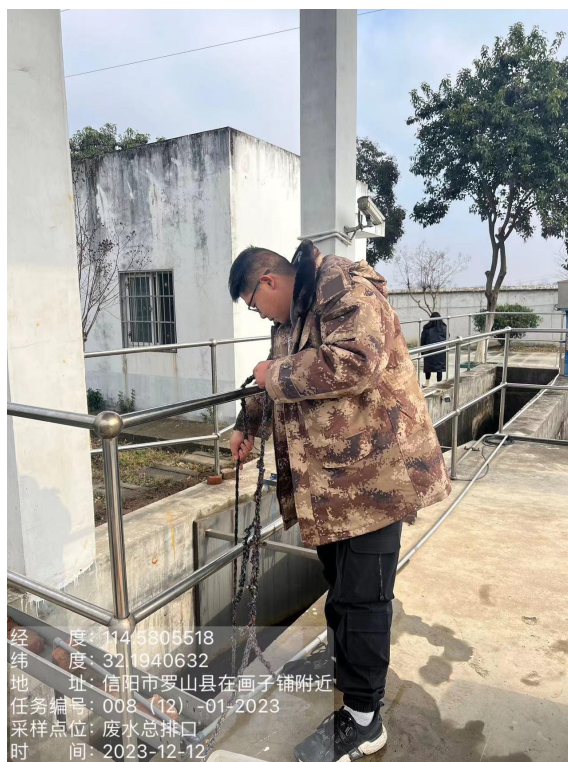
附图 3: 采样图片