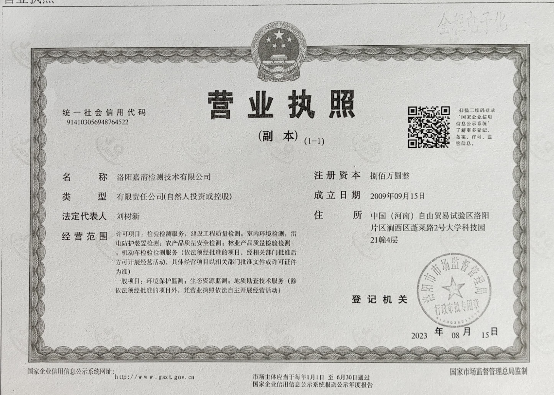
附图 1: 营业执照