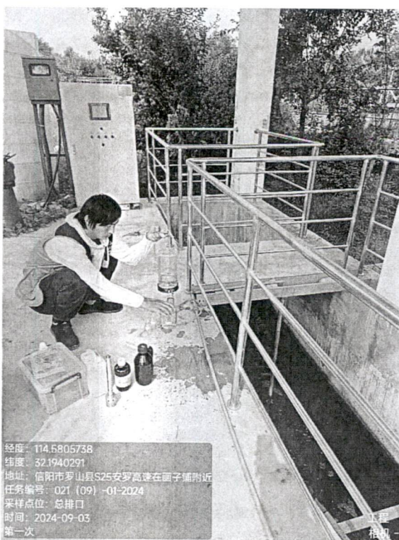
附图 3: 采样图片