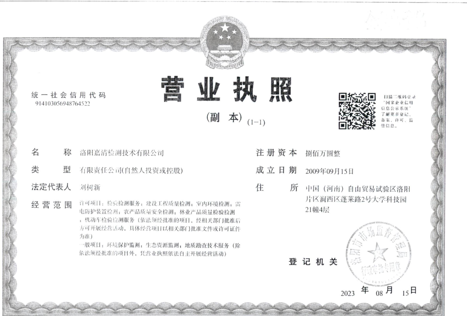
附图 1: 营业执照